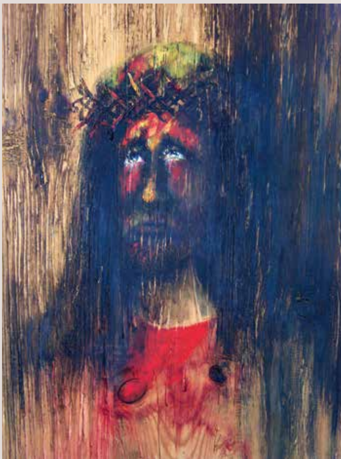
Ecce Homo 1963. Oli sobre taula. 63 cm x 40 cm.

Obra que pertany a una sèrie de taules dels anys '60 amb la representació de personatges bíblics. L'artista juga amb el suport per a donar una expressió més dramàtica del personatge.