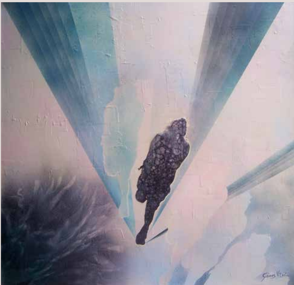
Quarta dimensió 1985. Tècnica mixta sobre tablex. 100 cm x 100 cm.

Obra que continua amb l'aplicació de materia pigmentada combinada amb oli i aerosols, creant una nova estètica aplicant moltes textures diferents dins una mateixa obra.