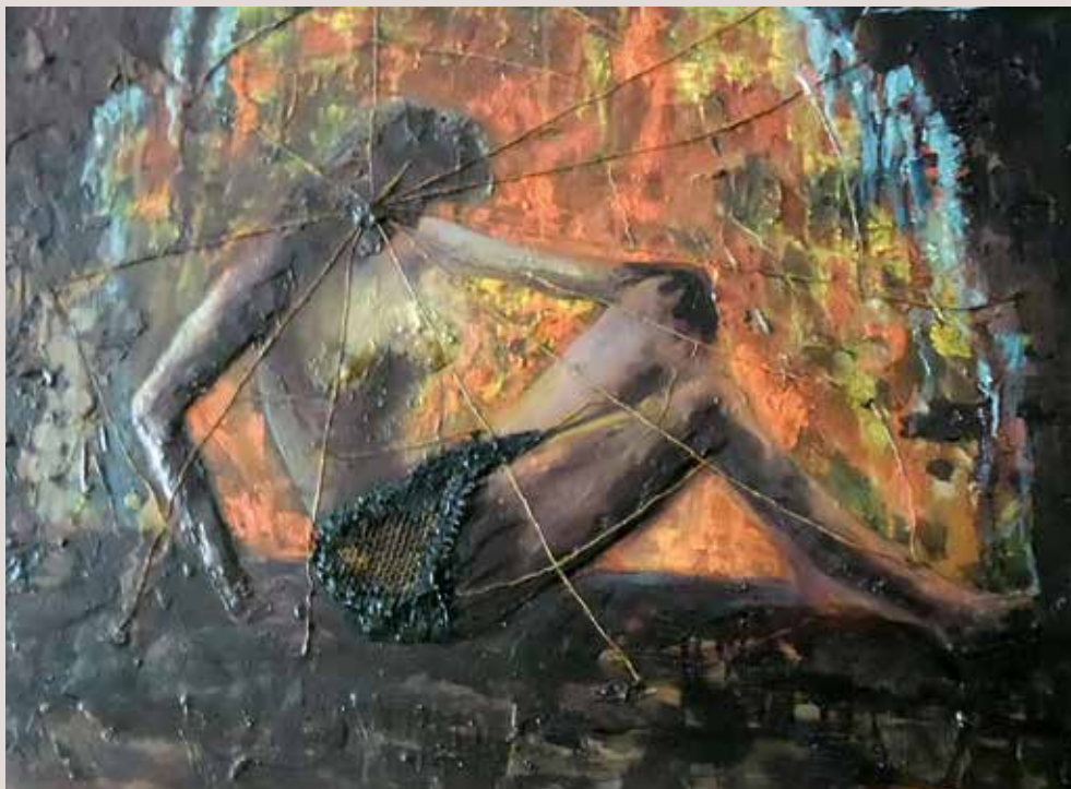
Aracnea 1965.Oli sobre llenç amb aplicacions. 60 cm. x 80cm

Fàbula d'Aracne. Escena on la jove Aracne és transformada en aranya per la deessa Atenea. Es fan servir aplicacions de tela d'arpillera per a fer referència a la tela d'aranya.