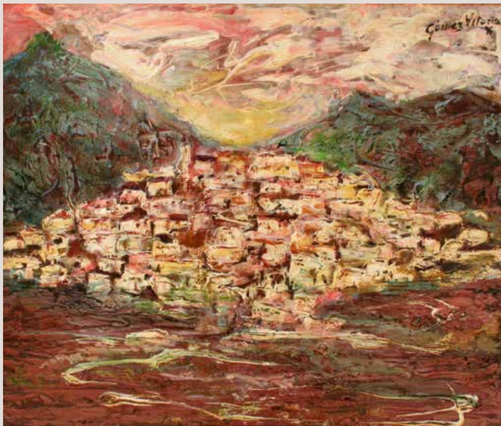
Busot 1970. Oli sobre taula. 49,5 cm x 59 cm.

Paisatge de la localitat de Busot. Destacar la visió personal de l'artista on dóna força al nucli urbà amb les tonalitats clares del nucli de cases que pugen per la muntanya.