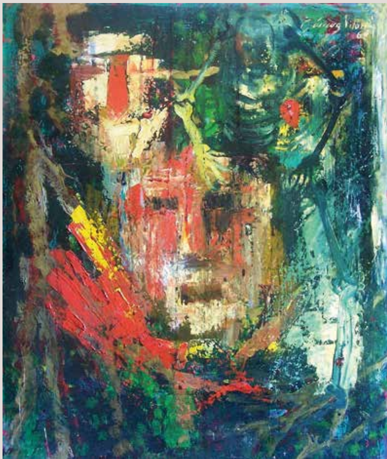
El final 1969. Témpera sobre tablex. 60 cm x 50 cm.

Representació de la vida, amb la imatge del passat al fons a través d'una figura difuminada, el present amb la imatge central i el futur amb l'esquelet que és la mort.