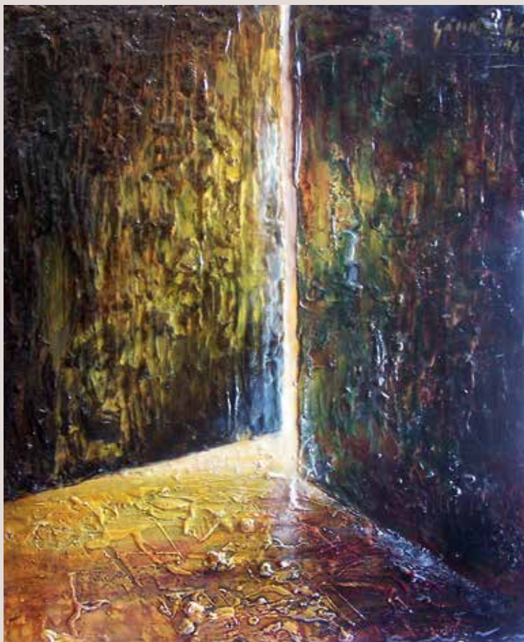
I... esperança 1972. Oli sobre taula. 50 cm x 40 cm.

Obra on l'artista ens ofereix una porta oberta com a representació de la salvació anímica. El futur, es troba darrere d'aquesta llum cegadora que ens convida a entrar.