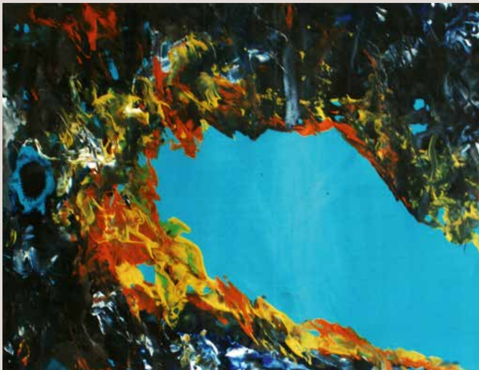
Coves del Canelobre 2007. Tècnica mixta sobre paper. 50 cm x 30 cm. Paisatge de les Coves del Canelobre a Busot. Representació expressionista del paisatge.