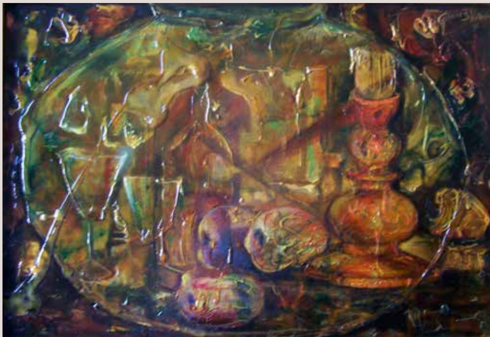
Bodegó 1976. Oli sobre llenç. 49 cm x 73cm.

Obra on es presenta un bodegó lluny de ser la clàssica representació. Incorpora tots els elements però els dona un tractament novetós per a aconseguir impacte.