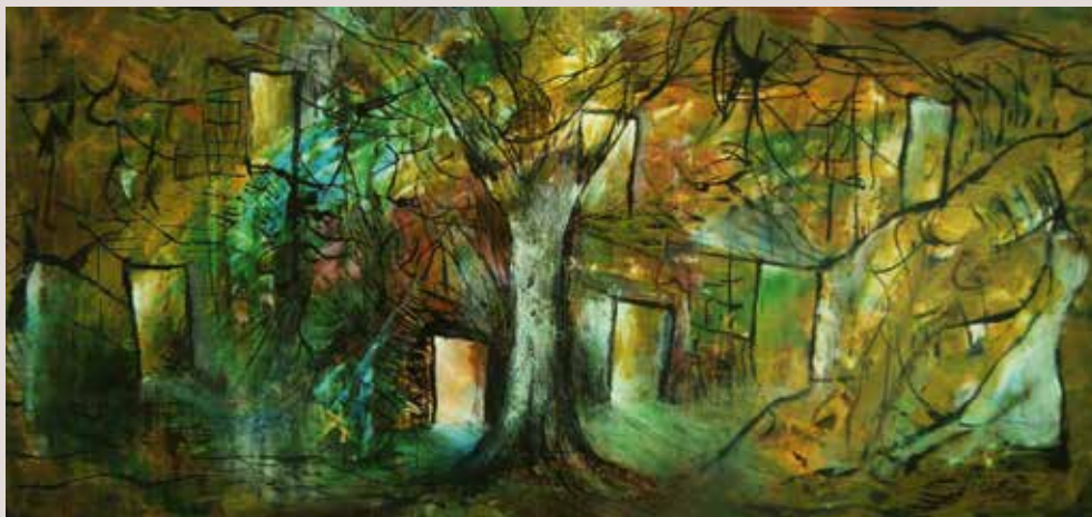
Set portes 2007. Tècnica mixta sobre paper. 50 cm x 60 cm.

Obra amb una simbologia religiosa, on les set portes son les set portes que duen a l'Infern, l'olivera de la part central representa la figura de Crist o la religió.