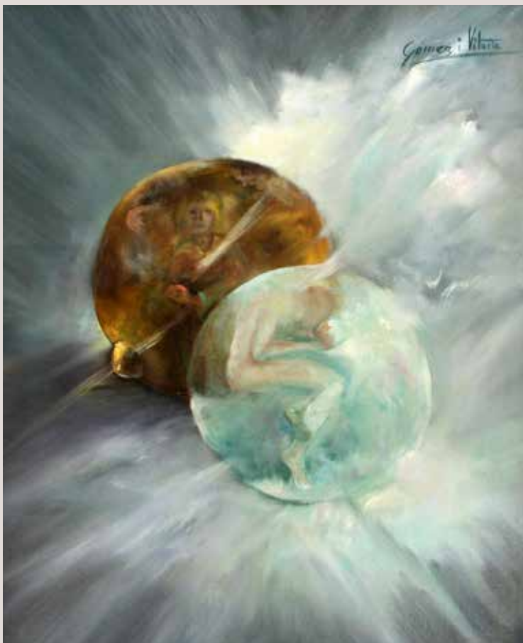
Choque de los mundos 1992. Oli sobre llenç. 55 cm x 45 cm.

Expressió de la relació interpersonal entre els éssers o les cultures, on cadascú viu dins el seu propi món i comprendre la resta suposa de vegades un xoc emocional.