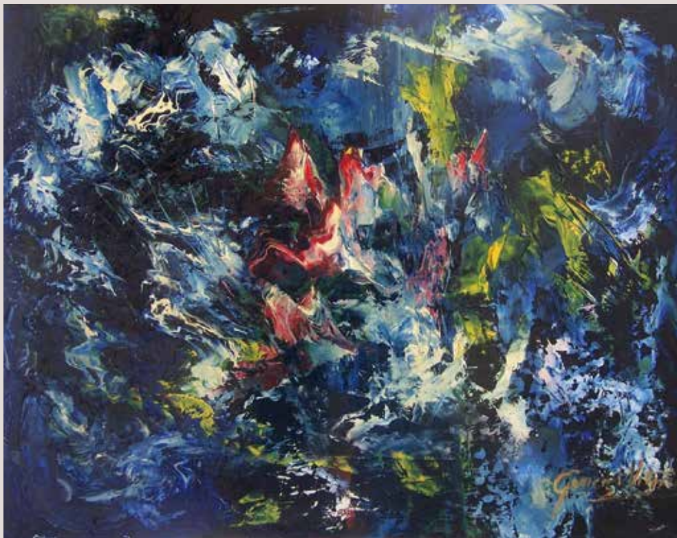
Abstracció 1995. Acrílic sobre tablex. 43 cm x 53 cm.