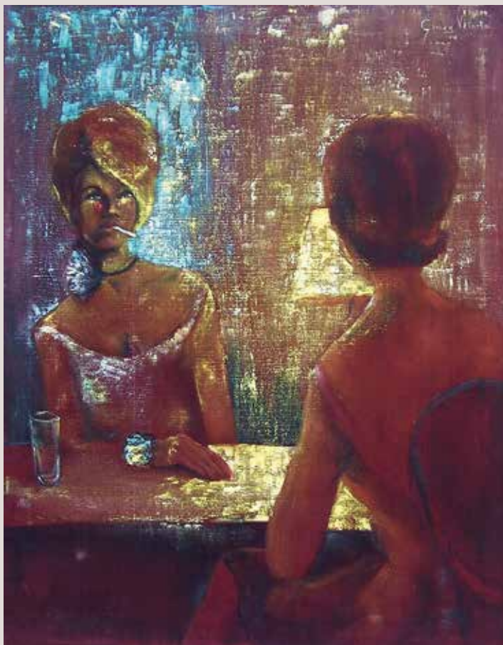
Matando el Tiempo 1966.Oli sobre vellut. 75 cm. x 60 cm.

Notar la dificultat tècnica causada pel suport que la resol aconseguint un gran resultat final. Representació de prototip de dona lliure i sense temors, front a la decència i la prudència