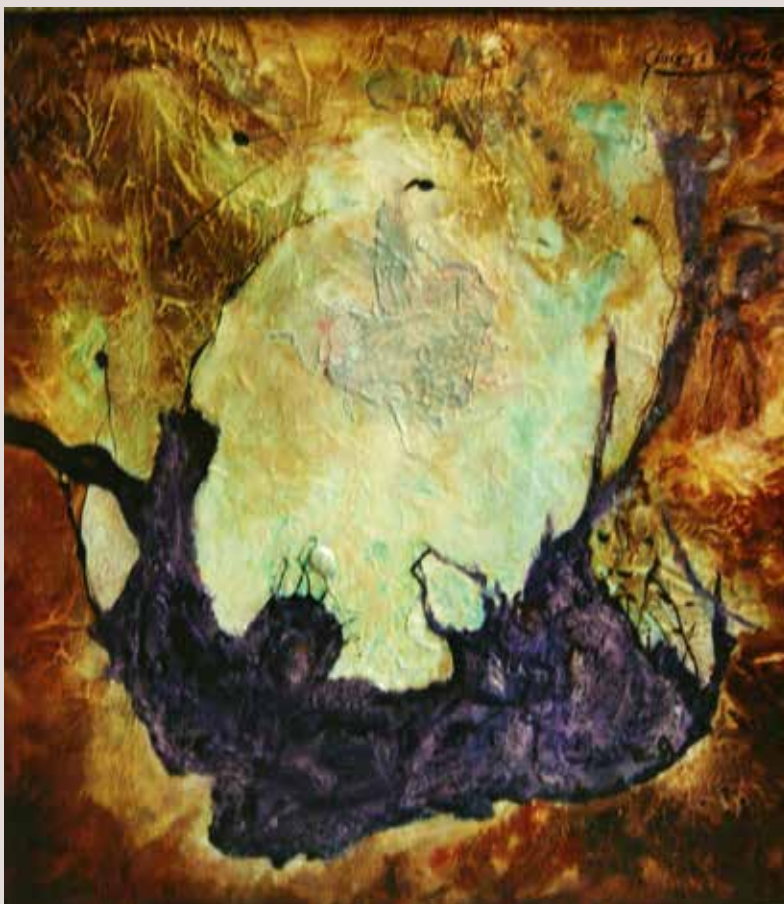
Catarsi 1999. Oli sobre taula. 65 cm x 70 cm.

Aquesta obra és una reflexió psicològica, on es representa el que suposa una catarsi, on es plasma l'alliberació d'una situació tensa mitjançant les emocions.