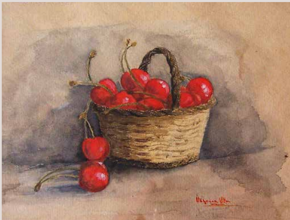
Cireres 1949. Llapis i aquarel·la sobre paper. 11cm. x 13,5cm.

Obra-estudi de la primera etapa de l'artista. Es reproduïx del natural una cistella plena de cireres, per tal de fer un estudi espacio-volumètric i de color.