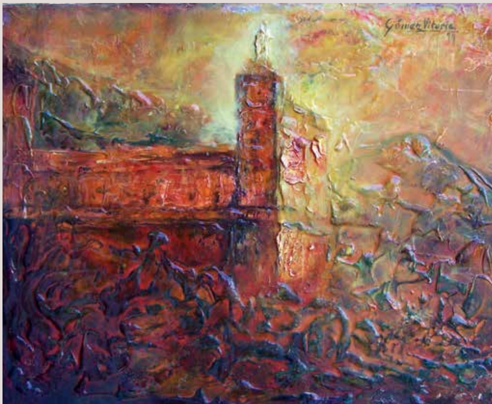
La Font Roja 1977. Oli sobre taula. 52 cm x 41,5 cm. Paisatge de la Font Roja. Atractiu tractament expressionista del paisatge, amb gran efecte cromàtic.