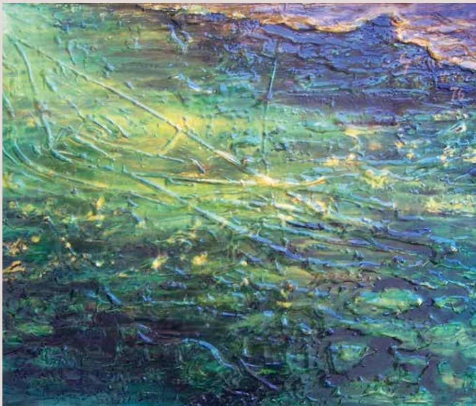
Els banyets o Banys de la Reina (Campello) 1970. Oli sobre taula. 32,5 cm x 40 ,5 cm.

Obra realitzada sota la visió Psique. Mostra del paisatge marí de la zona dels Banys de la Reina de Campello. Representa el reflex de l'aigua amb la tècnica de l'oli lacat.