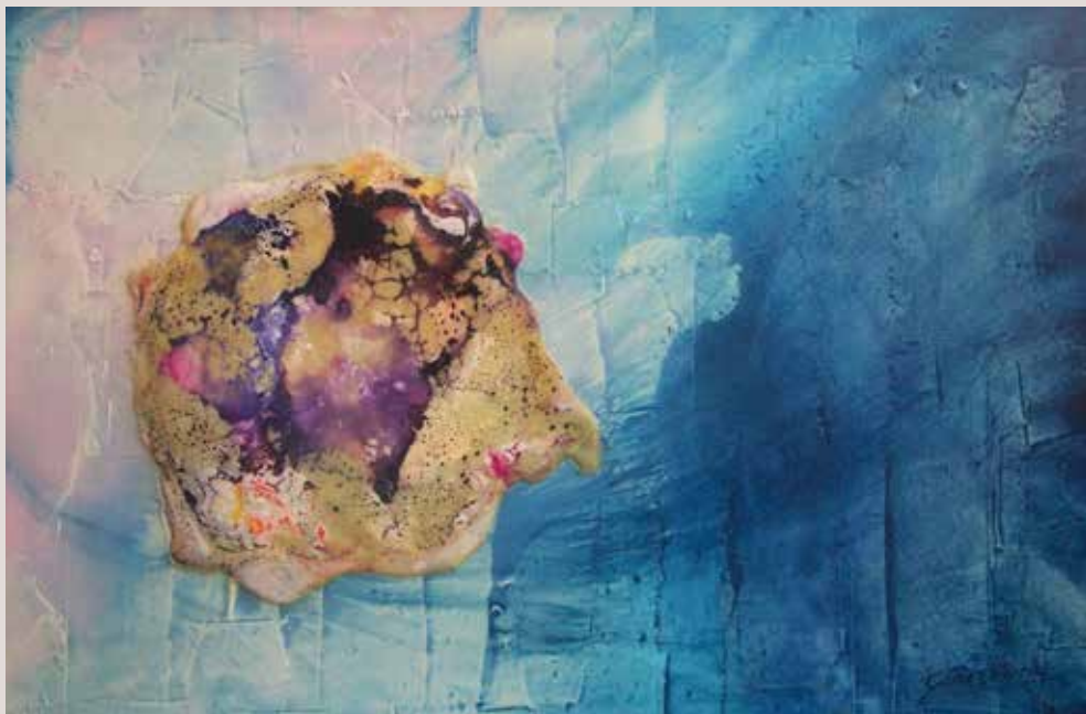
Sonidos II 1980. Tècnica mixta sobre tablex. 49 cm x 74 cm.

Obra on avança dins la seua investigació plàstica i treballa un aplic matèric amb incorporacions de pigments sobre un fons tractat amb olis.