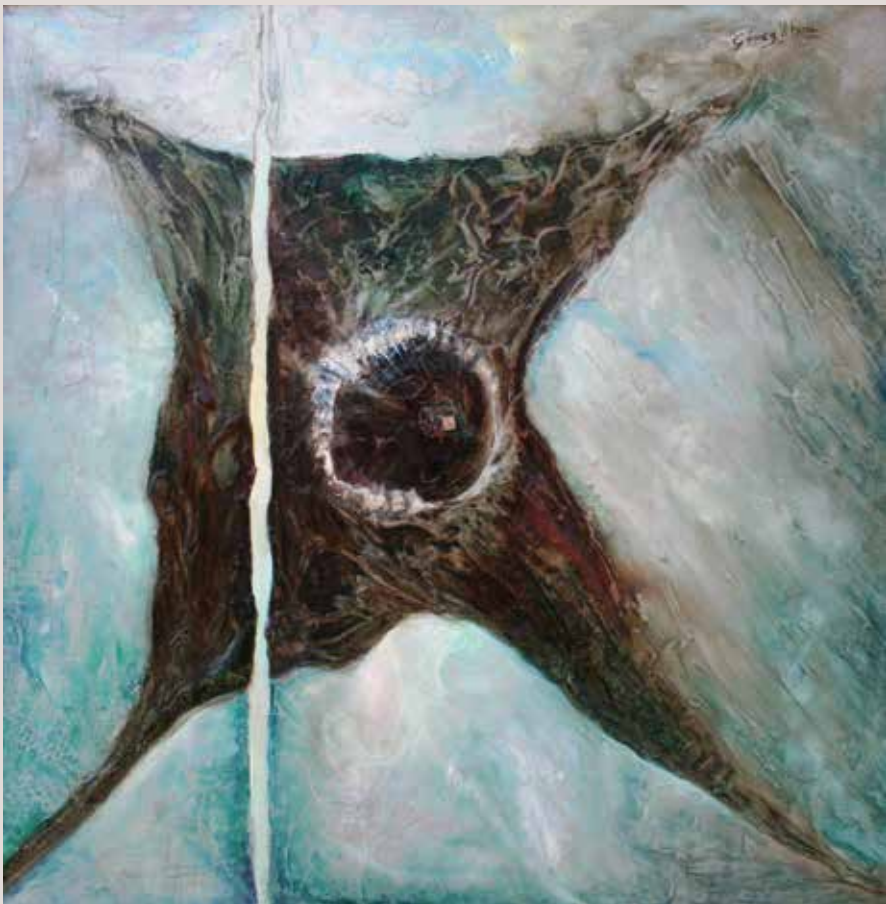
Galaxia 1989. Tècnica mixta sobre llenç. 50 cm x 50 cm.

Obra informalista, on demostra que l'artista abandona definitivament la figuració i s'acosta a les avantguardes.