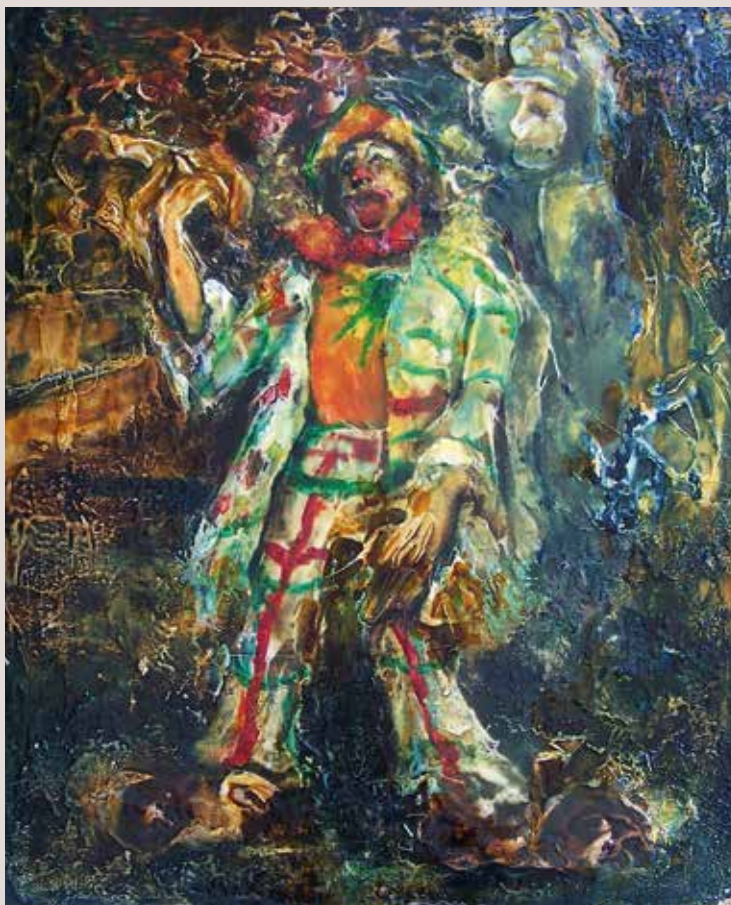
En Escena 1970. Óleo sobre lienzo. (100 cm x 80 cm)

Obra que entra dins del concepte de l'Escola Psique desenvolupat per l'artista als anys '70. Representa l'objecte després de passar per el seu filtre emocional. Estariem dins d'un tipus d'expressionisme.