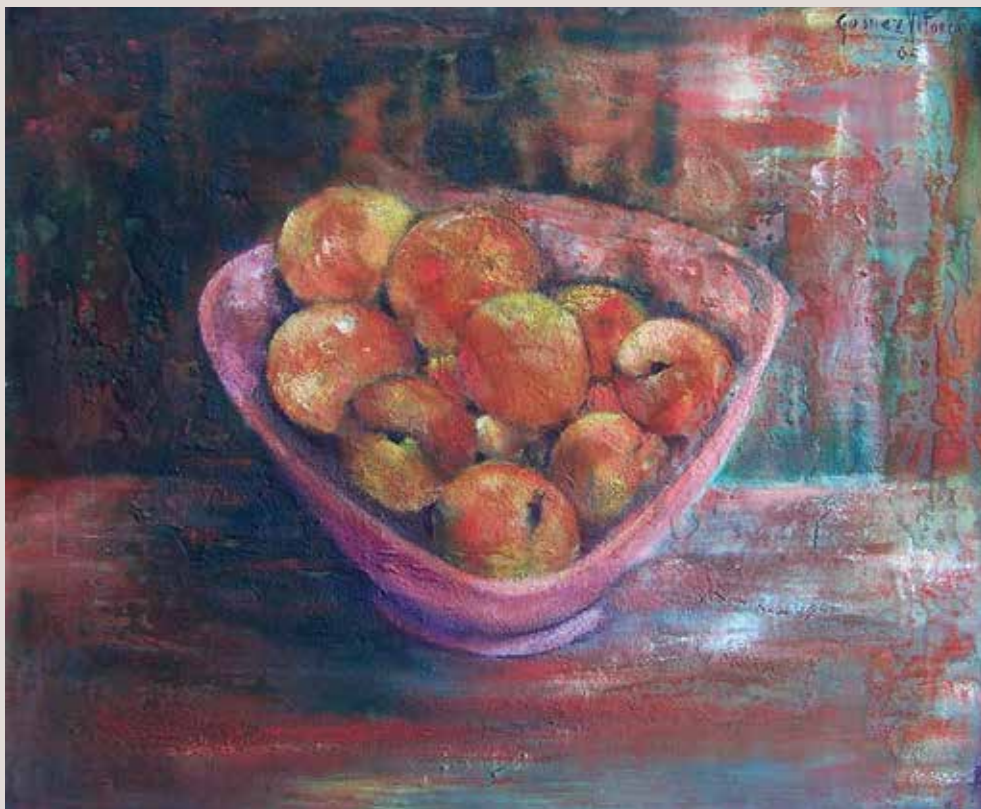
Melocotones 1965. Oli sobre llenç. 46, 5 cm x 56, 5 cm.

Obra on ja es pot veure que la pinzellada és més solta, estudi del color i de la llum, interessa la variació de cromatisme creada per la il·luminació.