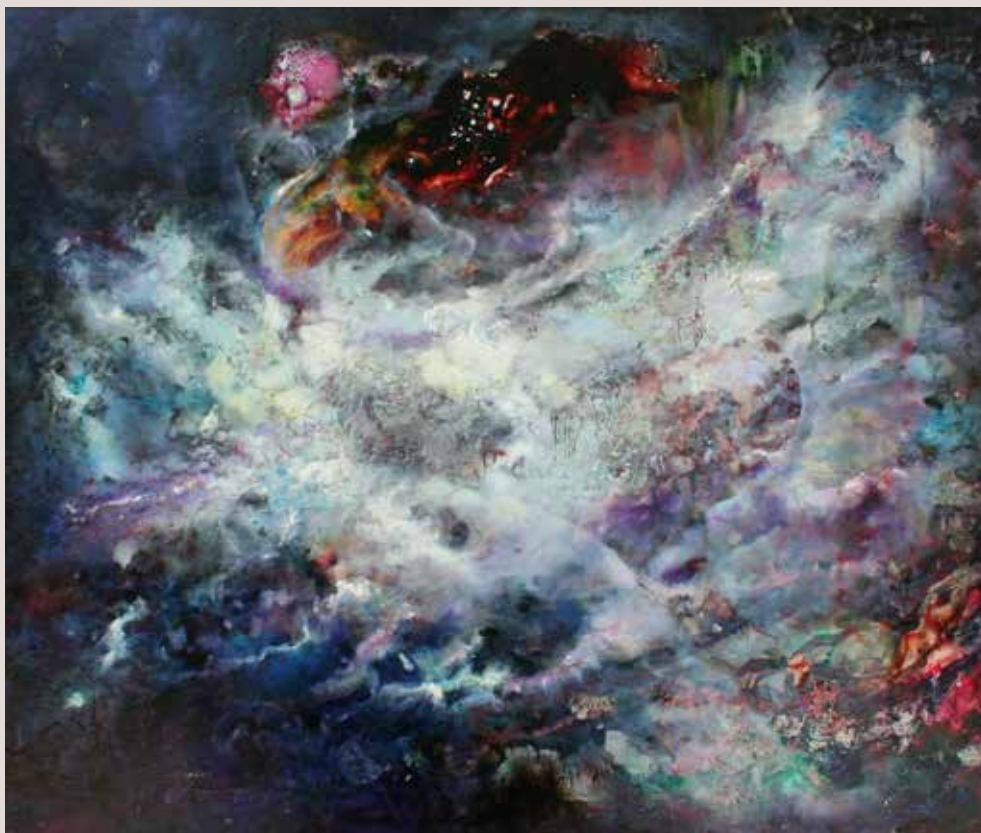
Principi 1990. Tècnica mixta sobre tablex. 65 cm x 50 cm.

Obra inclosa dins l'abstracisme, l'artista dins la seua evolució cap a noves formes d'expressió inicia un camí cap a l'onirisme per a poder expressar-se.