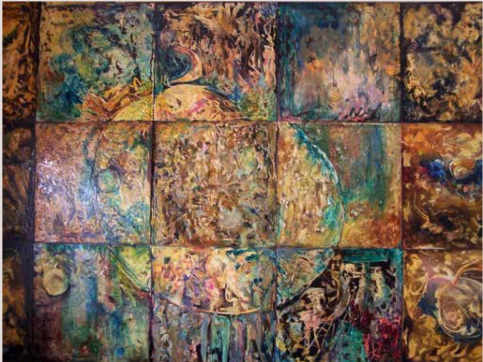
L'Apocalipsi 1974. Oli sobre tablex. 2 mt x 1,5 mt.

Obra de grans dimensions i nova proposta dins la seua trajectòria. Representació de l'Apocalipsi vist des d'un punt de vista inclòs a l'expressionisme abstracte.