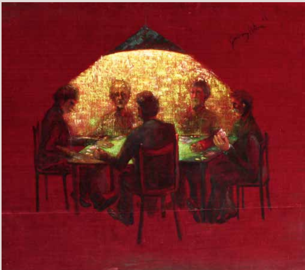
Joc o Póker 1966. Oli sobre vellut. 90 cm x100 cm

Obra que pertany a la sèrie dels velluts, que va suposar un èxit a l'exposició de la Galeria Syra de Barcelona (1968). Grup de jugadors emfatitzats per la llum central.