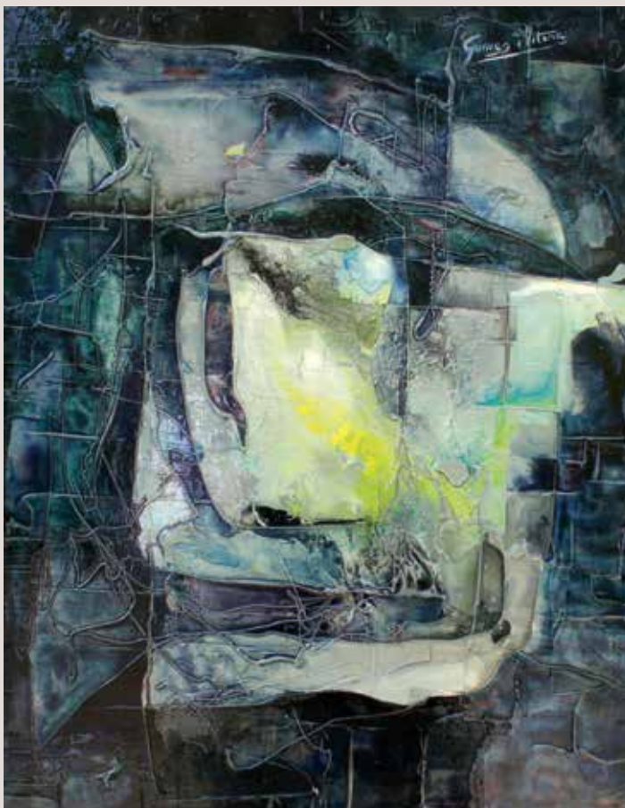
Estudi de grisos 1980. Tècnica mixta sobre tablex. 65 cm x 50 cm.

Obra on l'artista abandona la figuració i es centra en representar les impressions de forma abstracta. Estudi de les diferents projeccions cromàtiques dins de la proposta.