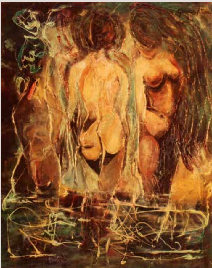
¿Eres tú? 1975. Oli sobre llenç. 75cm x 60cm

Representació d'un grup de figures femenines sense rostre, com si estigueren dins un somni i no es pogueren reconèixer. Tècnica estilística inclosa a l'expressiome figuratiu.