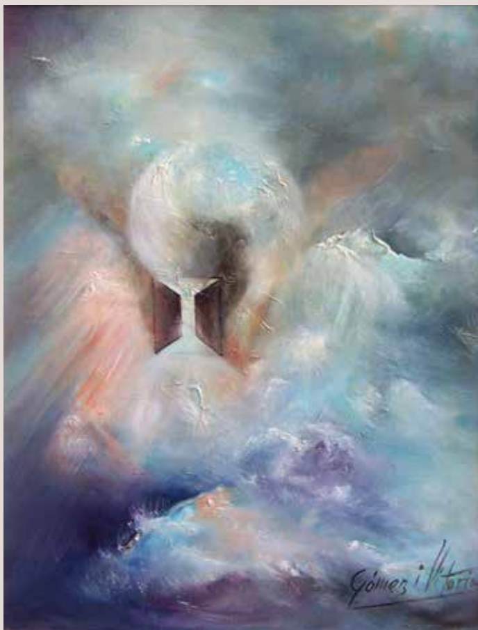
Arribada 1992. Oli sobre llenç. 24 cm x 26,5 cm.