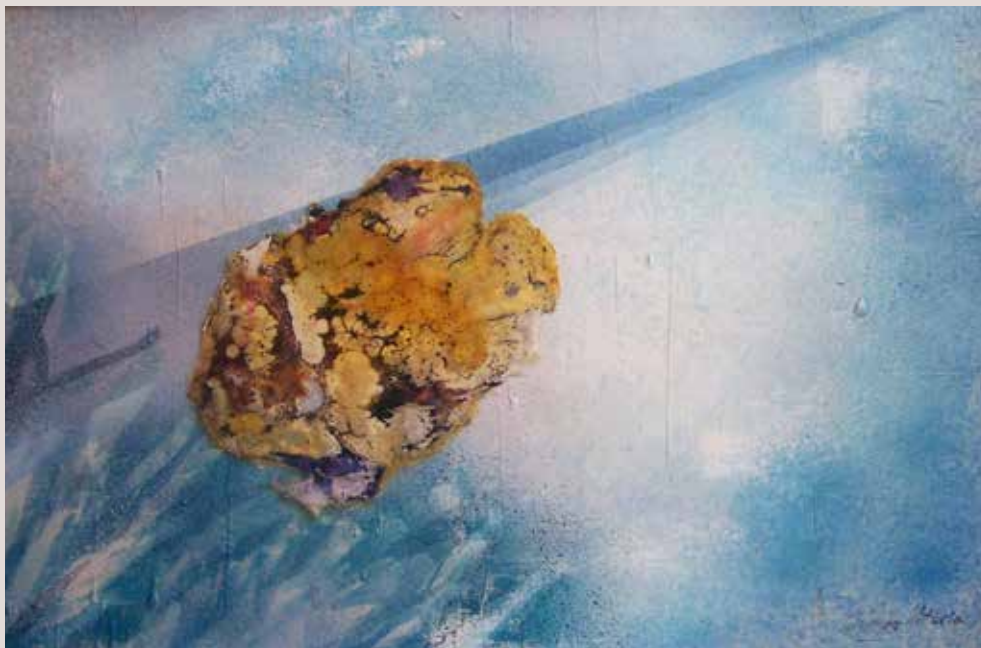
Sèrie Sonidos 1980. Tècnica mixta sobre tablex. 49 cm x 74 cm.

Als anys 80 l'artista treballa en el projecte de l'Església de Santa M a Magdalena de Lorxa; i per a fugir de volta en quan, crea una sèrie nova d'estil informalista: Sonidos.