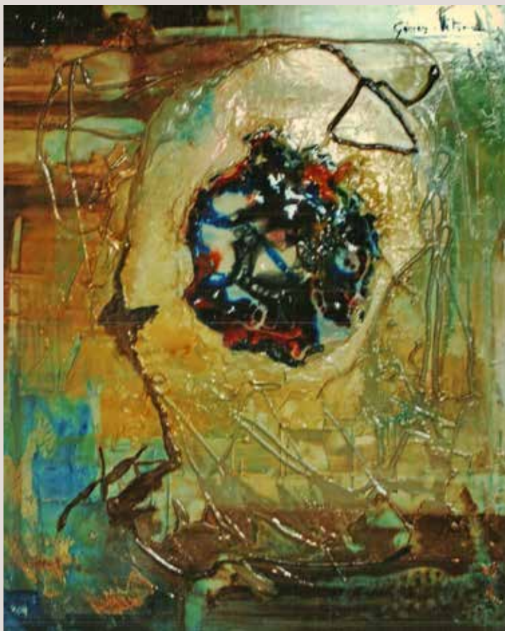
Incògnita 2008. Tècnica mixta sobre llenç, 34 cm. x 40 cm.

Obra on l'artista realitza proves de matèria, experimenta amb els materials i els pigments a fi de crear un aplic que incorpora sobre el llenç.