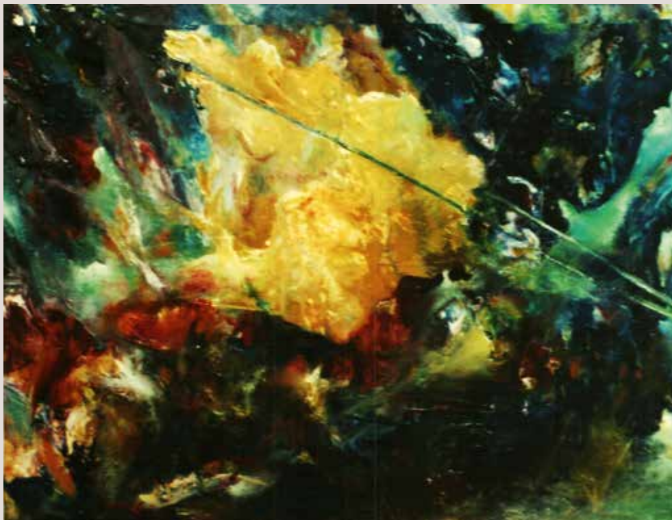
Guerra (Homenatge a Goia) 2005. Oli sobre taula. 46 cm. x 66 cm.

Obra basada en els Afusellaments del 3 de maig de Goia (1814). Mila Gómez reversiona plàsticament el tema mitjançant la representació expressionista abstracta.