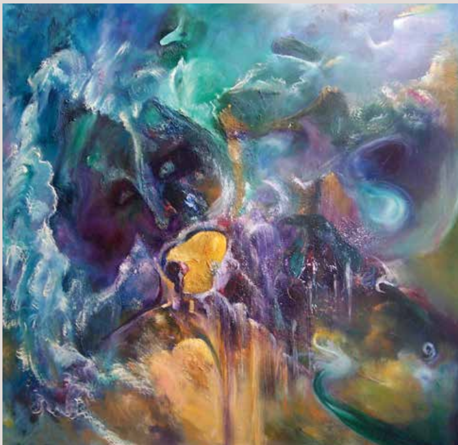
Imatges a l'aire 2002. Tècnica mixta sobre tablex. 97 cm x 97 cm.

Una altre gust d'aquesta artista és amagar rostres dins les obres, separeu-vos i observeu... no els veieu?