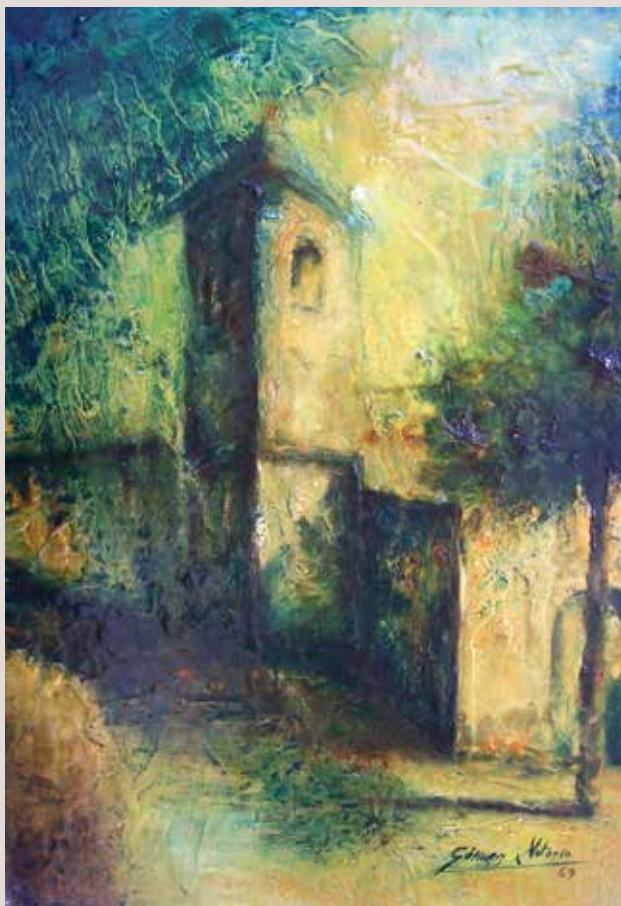
Turballos 1969. Óleo sobre tabla 46 cm x 32 cm.

Paisatge del Campanari i l'esglèsia de San Francisco de Paula de la eco-aldea de Turballos. Les tonalitats escollides traslladen els fonaments d'aquesta comunitat.